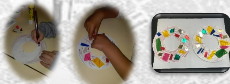
Dia de Reis