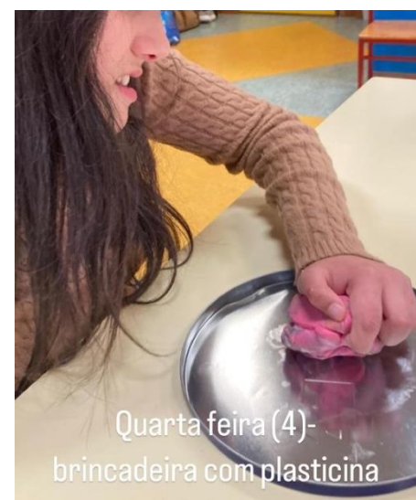
Quarta feira (4)- brincadeira com plasticina