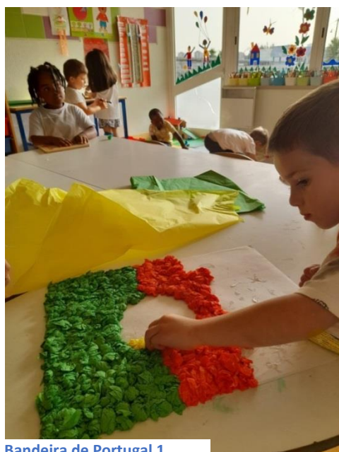
Bandeira de Portugal 1