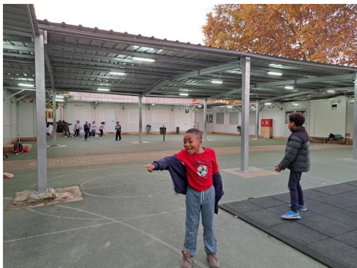
Caça ao Monitor 1