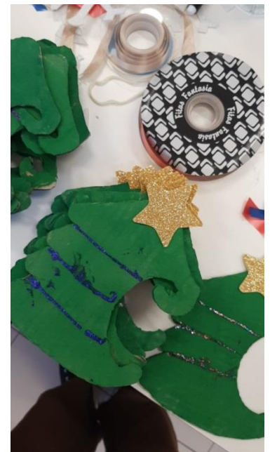
Preparação prenda de Natal 1