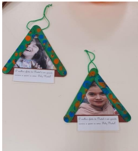
Preparação prenda de Natal 2