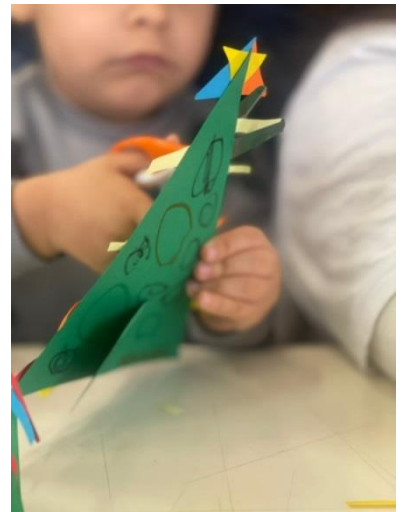
Decoração de Natal 1