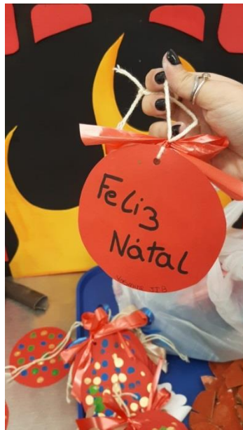
Preparação prenda de Natal