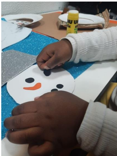
Boneco de neve (decoração) 1

Para celebrarmos o Natal e entrarmos no Espírito Natalício fizemos a decoração da nossa escola. Não deixamos de fazer uma lembrança para a nossa família!