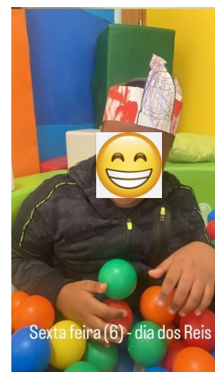
Sexta feira (6) - dia dos Reis