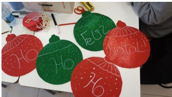
Decoração de Natal 2