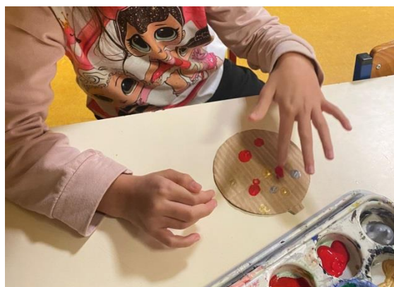
Pintura com Tintas 1