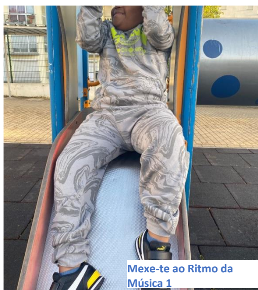
Mexe-te ao Ritmo da Música 1