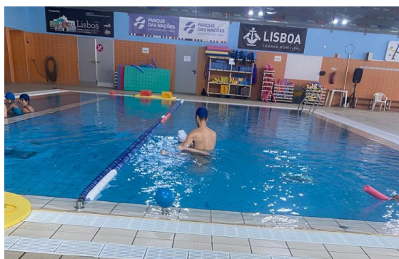
Piscina do Oriente 1

Às segundas feiras é o dia de Piscina, que é bastante importante para estes alunos, pois são feitos exercícios que trabalham os membros e os tornam mais ativos.